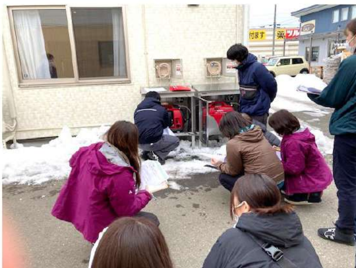
北良さんからの説明を聞いている様子

一般社団法人芳心会様から助成金をいただき、1月末にさぶりフリースペースにLPG発電機を設置しました。2月には設置業者さんである北良株式会社様の説明会を実施し、職員が使用の説明を受けました。停電になった時に使えるガスを使う発電機を設置できたことで、有事には地域の避難所としての役割を果たしたいと考えています。今後、月1回の訓練を職員で行い、さぶりを利用する皆さんにも周知していきます。障がいがあっても安心して避難できる場所となるよう努めていきます。